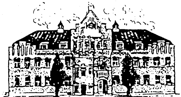
Gamla Badhuset i Karlstad, som numera huserar Värmlandsarkiv, Folkkrörelsernas arkiv och Emigrantregistret.