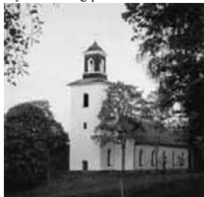
Östra Ämterviks kyrka