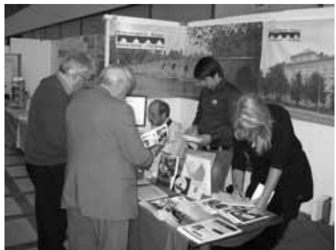
Emigrantregistret fullbordade det Värmländska inslaget.