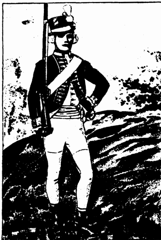
Kungl. Närkes och Värmlands Reg 1778.

Välkomna till Värmlandsarkiv för att spåra Era förfäder i de värmländska knektlängderna.