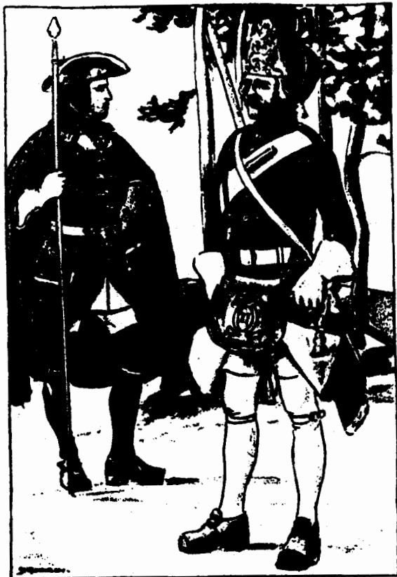
Kungl. Närkes och Värmlands Reg. Officer, Grenadjär, 1690.

diskuterade val av knektar i tingsstugan. När förrättningen var klar fördes de till knektar uttagna männen upp på en utskrivningslängd. I utskrivningslängden stod knektarna tills de slutligen mönstrades som soldater och uppfördes i en ny rulla.